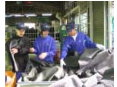
写真は、以前の取組のものです。

キャリア教育の一環として、例年行っている、職場体験学習を今月30日から来月1日までの3日間実施します。この学習は、実際に3日間勤務して各職場で働いておられる方々と交流することにより、外部からは分からない、働くことの喜びや意義等について身を持って体験することが狙いです。