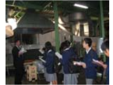
写真は、以前の取組のものです。

この取り組みを通して、各企業の願いや考えを知り、職業についての認識がより深まってほしいものと考えています。